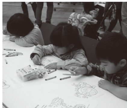
ドラえもんのおえかき