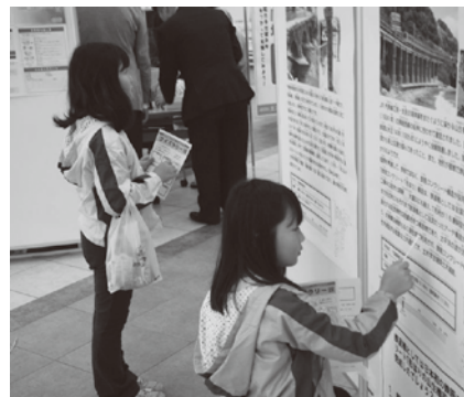
クイズラリーの様子