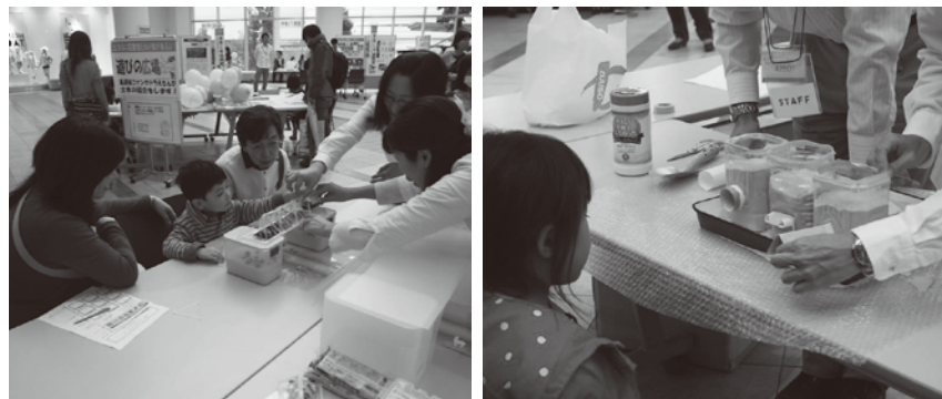
体験広場 “丈夫な橋の作りかた”