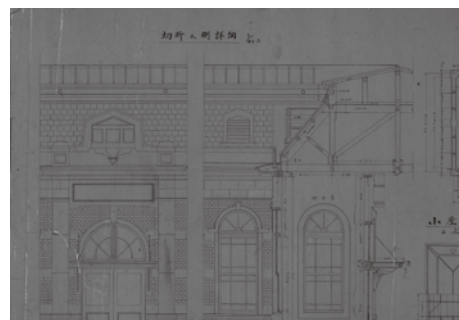
旭浄水場 送水所詳細図