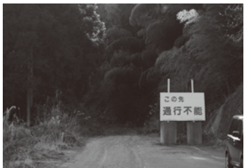
県道南指原岩間停車場線 道祖神峠