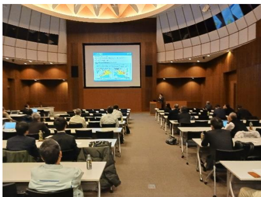
II部 南海地震四国地域学術シンポジウム