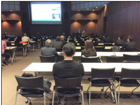
I部 自然災害フォーラム