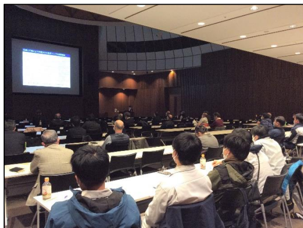
II部 南海地震四国地域学術