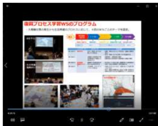
II部 南海地震四国地域学術シンポジウム