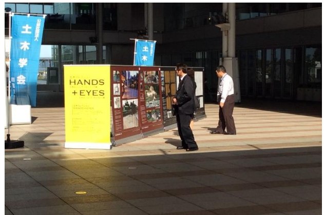
展示物を鑑賞される状況