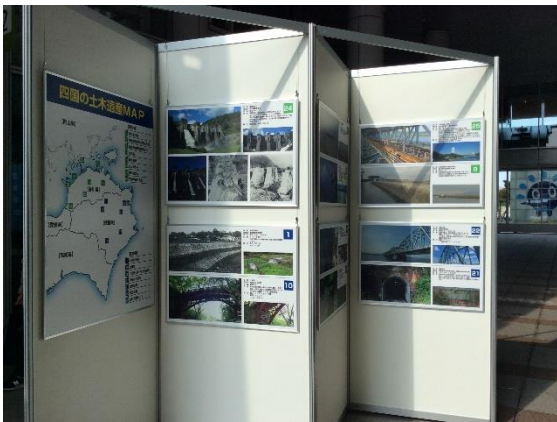
土木遺産パネル展示物状況