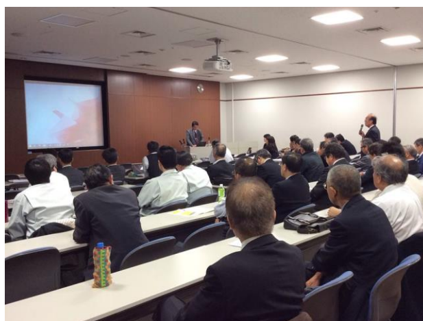
活発な質疑応答の様子